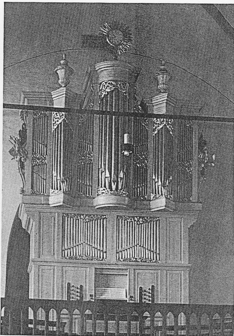
Het orgel na de restauratie