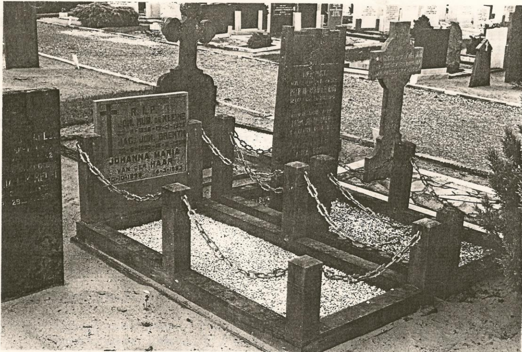
Perk 13, nr. 28 en 29 met paaltjes en kettingen.

Beeldpagina tussen 30 en 31 in oorspronkelijke document